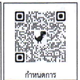
กำหนดการ